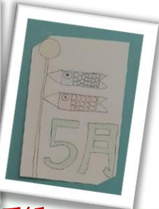
創作活動「季節の絵手紙」