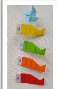
創作活動「こいのぼり飾り」