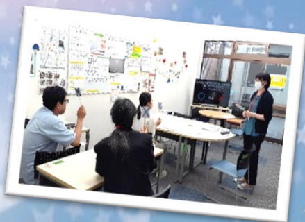
勉強会「食中毒について」