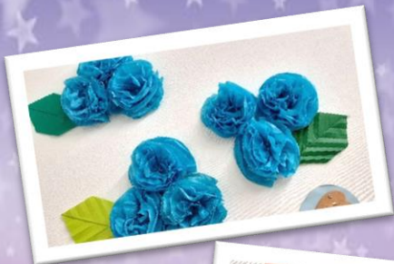
創作活動「梅雨を感じる飾り」